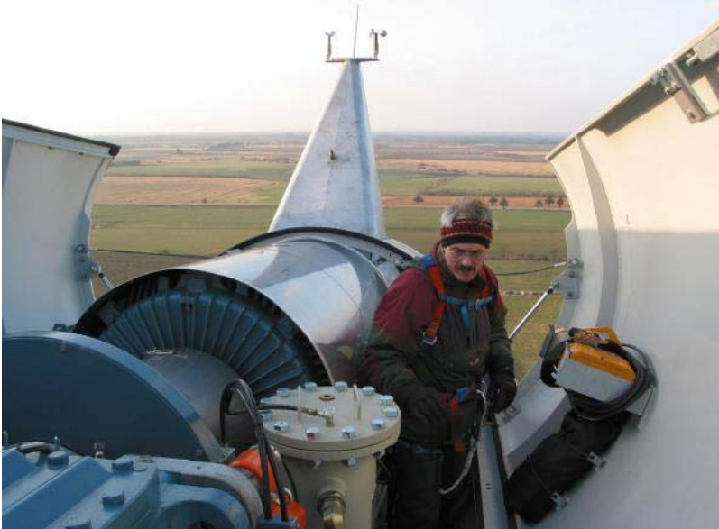
Verly inspicerer mølletoppen...