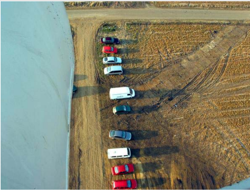
Et kik ned fra møllens top...